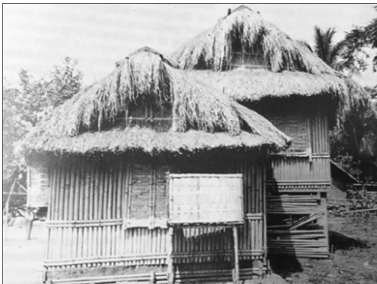
(larawan mula sa CCP Encyclopedia, vol. 1, Peoples of the Philippines, p. 315)

Maaaring ipagtaka ang “pagpapababa” ng bintana dahil karaniwang ginagamit ang salitang “buksan”. Sa tradisyonal na bahay-lloco, literal na ibinababa ang mga bintana. May siwang ang mga dingding nito kung saan ilulusot ang mga de-tanggal na bintanang kahoy o sawali. (Magandang makapagpakita ng tunay na larawan ng mga tradisyonal na bahay-lloco upang higit na maging malinaw ang paglalarawan)